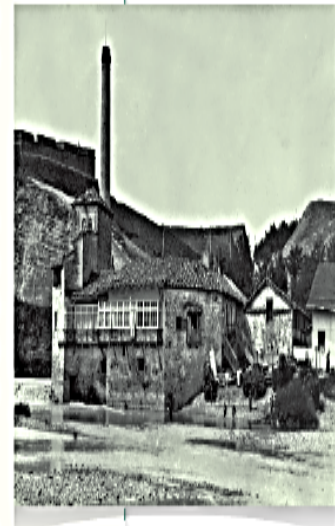
▲ Molino de vapor de principios del siglo XX, ubicado en Pamplona, España.

Se dice que el cultivo del trigo en América fue introducido por la colonización inglesa en las tierras conquistadas. Otras teorías plantean que el trigo entra a América cuando inmigrantes rusos lo trajeron a Kansas, Estados Unidos, en la década de 1870.